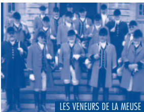
LES VENEURS DE LA MEUSE