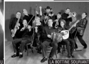
LA BOTTINE SOURIANTE