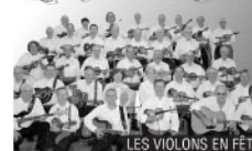
LES VIOLONS EN FÊTE