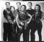
« QUÉBEC, JE ME SOUVIENS »