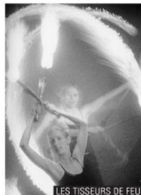
LES TISSEURS DE FEU