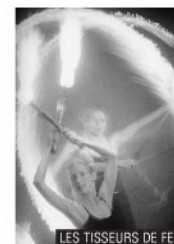
LES TISSEURS DE FEU